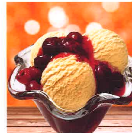
Eis & Heiß mit Kirschen

Drei Kugeln Eis Vanillegeschmack mit warmen Sauerkirschen.