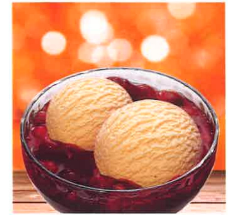
Rote Grütze mit Eis

Fruchtige Rote Grütze mit zwei Kugeln cremigen Bourbon-Vanilleeis.