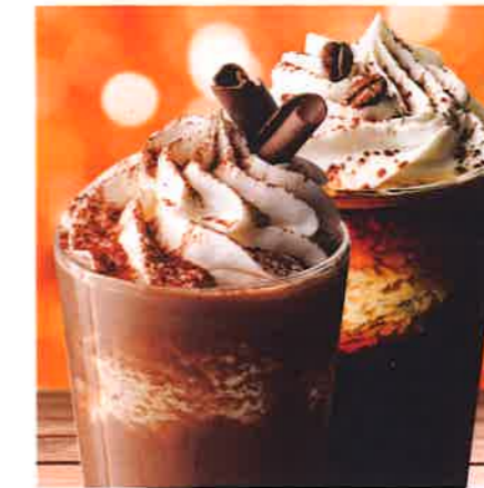
Eisschokolade / Eiskaffee

Köstliches Schokoladengenränk oder aromatischer Kaffee mit Bourbon-Vanilleeis und einer Sahnehaube.