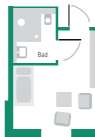
Musterbeispiel eines Einzelzimmers in der Kurzzeitpflege