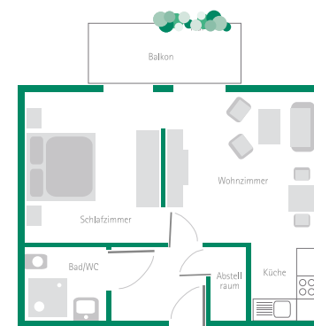
Der Grundriss zeigt eine Wohnung im Betreuten Wohnen.