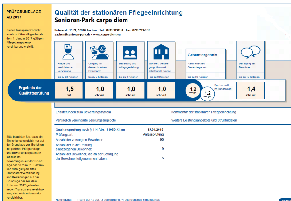
Abbildung 2: Qualitätsprüfung der stationären Pflege

Der MDK führte 15.01.2018 die unangemeldeten Regelprüfung im stationären Bereich durch. Die Ergebnisse dieser Prüfungen konnten optimal dazu genutzt werden, die gute Pflegequalität zu sichern und auch zu steigern. So hat der Senioren-Park carpe diem Aachen auch im diesen Jahr seine gute Note der MDK-Prüfung von "einer 1 vor dem Komma" behaupten können. Dies ist nicht zuletzt auf die sehr gute Zusammenarbeit und die hohe Motivation der unterschiedlichsten Professionen im Haus zurückzuführen.