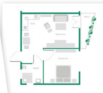
Musterbeispiel einer Zweizimmer-Wohnung im Betreuten Wohnen