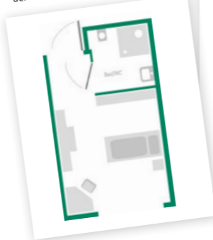
Musterbeispiel eines Einzelzimmers der ambulanten Wohngemeinschaft